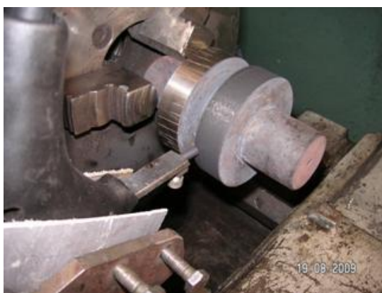
Рис. 2 – ЦЭЭЛ стали 40Х с использованием токарного станка. Ионное азотирование образцов проводили при температуре 520 °С в течение 12 ч на установке НГВ-6,6/6-И1

На всех этапах обработки измеряли шероховатость поверхности на приборе профилографе - профилометре мод. 201 завода «Калибр».