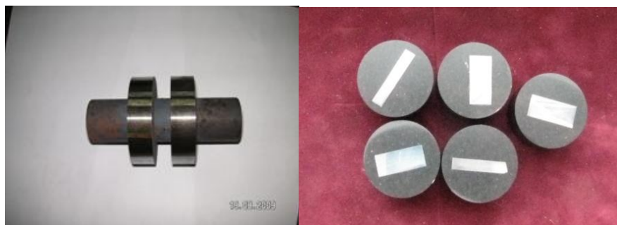
а б Рис. 1 – Образец для ИА и ЦЭЭЛ (а); шлифы (б).