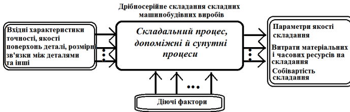
Рис. 1 – Інформаційна схема технологічної операції складання виробу

Постановка задачі: Технологічний процес складання містить дії з установки і утворення з'єднань деталей, складальних одиниць у виріб. При цьому враховується доцільна техніко-економічна послідовність отримання виробу (рис. 1).