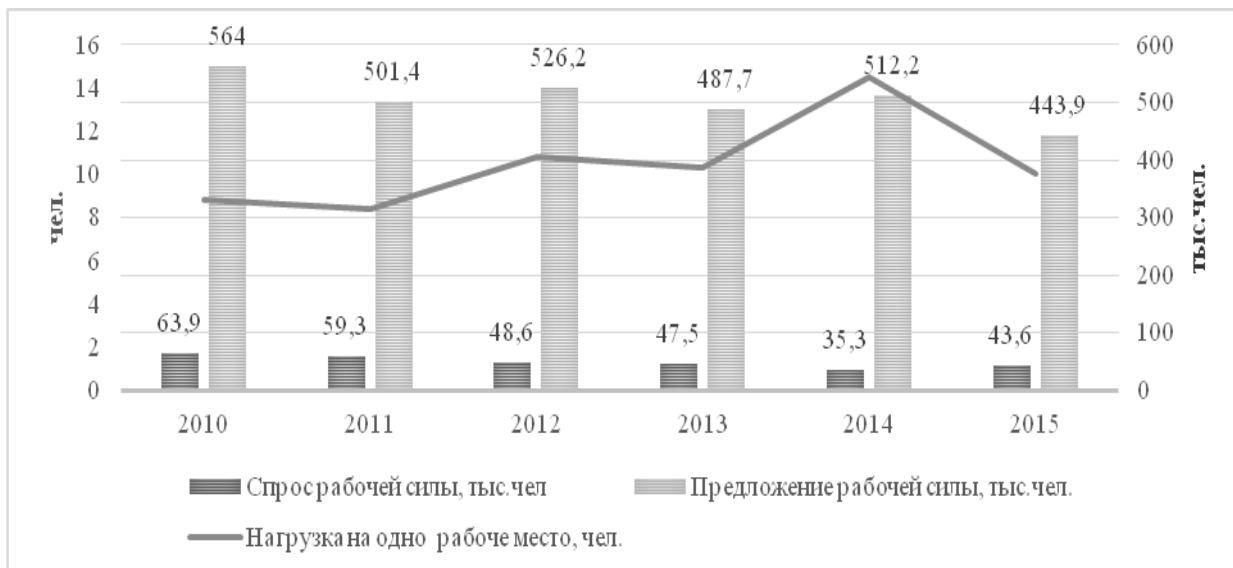
Рис. 2 - Спрос и предложение рабочей силы на рынке труда Украины за период 2010-2015 гг.

По данным Государственной Службы статистики Украины на протяжении 2015 г. (данные являются квартальными и отображены на конец периода – январь-июнь) уровень занятости в региональном аспекте был неоднородным. Максимальное значение показателя наблюдается в Днепропетровской и