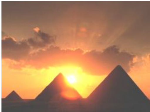
Рис. 1 – Пирамиды в Гизе