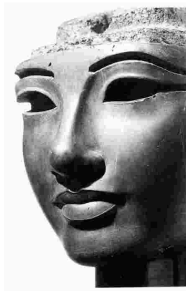
Рис. 5 – Голова фараона Аменофиса III из твердого камня

То, что египтяне использовали бетон – это не значит, что из него целиком построены пирамиды. «Применялась (то есть не везде) на верхних уровнях сооружений», а на нижних все те же блоки из известняка [2].