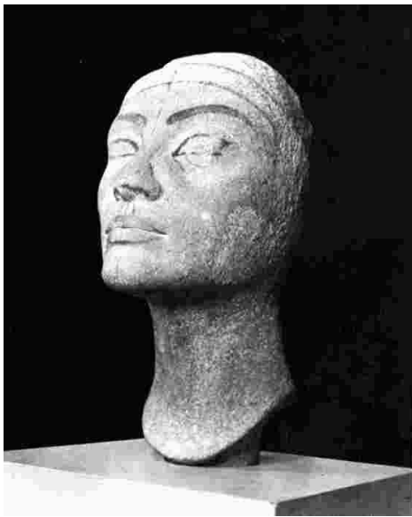
Рис. 4 – Незаконченная «древне-египетская» скульптура Нефертити из твердого камня, кварцита

На рис. 5 приведена фотография головы фараона Аменофиса III, где не видно швов. Скульптура полностью отшлифована.