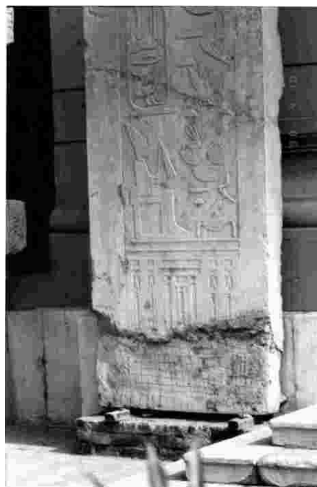
Рис. 3 – Древнеегипетская плита с иероглифами

Это – БЕТОННАЯ плита. На отколоте месте СОВЕРШЕННО ЧЕТКО ВИДНЫ СЛЕДЫ АРМАТУРЫ . По-видимому она была сделана из прутьев или веревок. Арматура придает бетону дополнительную прочность. Сегодня ее делают из железных прутьев. Арматуру в «древнем» Египте делали из прутьев или из веревок [2].