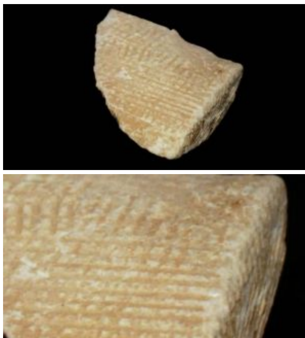
Рис. 2 – Фрагмент обломка каменного блока пирамиды Хеопса

На рис. 3 фотография древнеегипетской плиты, покрытой иероглифами. В 1999 году она была выставлена в Египетском Музее в Каире. Низ плиты отколот, что позволяет увидеть – как она была изготовлена.