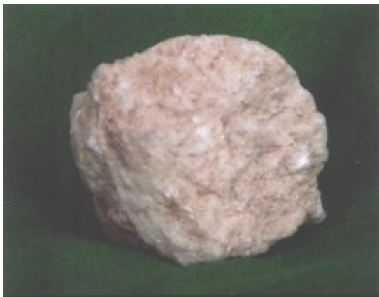
Рис. 6 – Фрагмент обломка каменного блока египетской пирамиды

На рис. 6 фотография привезенного из Египта образца – фрагмента обломка каменного блока египетской пирамиды, при исследовании которого