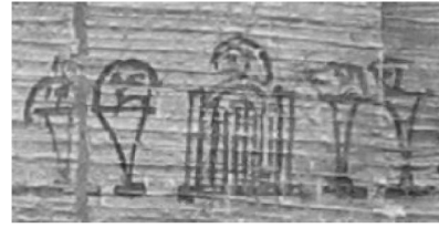
Папірус 56 (pLondon BM EA 10038.3)