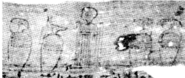
Бинт 74 (mSaqqara R. 421) [8, іл. 18]

нуфа – коричневою, а померлого – червоною). Амсеті частіше показується з бородою (крім 74, 85), а померлий, здається, завжди без. Напрямок обернення голови померлого буває різним, але частіше голову спрямовано в бік Дуамутефа із Амсеті (74, 77, 85, 86), аніж у бік Хапі з Кебехсенуфом (73, 90). Найбільш розповсюджена диспозиція богів представлена таким чином (зліва-направо): Дуамутеф, Амсеті, Хапі, Кебехсенуф (73, 86, 90; можливо до цієї ж схеми належать і бинти 70 та 71); інший варіант – це її дзеркальне відображення справа-наліво (77, 85); лише в одному випадку порядок розташування богів відмінний: Амсеті, Дуамутеф, Хапі, Кебехсенуф (74; можливо також і 79). "Поховання" зображується або вертикальним (74, 85, 86 і, напевно, 79), або квадратним (73, 77, 90); іноді його розміщено на підставці (70, 73, 77, 90) або ж санях, що поставлені на ніжки (у сумнівному 85); на бинті 77 "поховання" не має звичного пагорбу. Оздоблення "поховання" у всіх випадках, де це можливо встановити, має вертикальні смуги на основній частині (73, 74, 77, 79, 85, 86, 90) і, часто, концентричні лінії на пагорбі (73, 74, 85, 90).