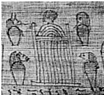
Бинт 75 (mWien ÄS 3848) [9, іл. 252]