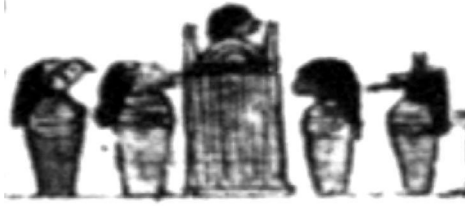
Папірус 54 (pChicago OIM 9787 ("pRyerson")) [2, іл. XIV]