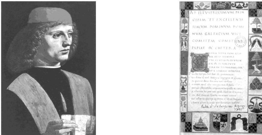
Рис. 3. Антоніо Корназано "Книга про мистецтво танцю"

Як і всі відомі тогочасні писемні пам'ятки запису танців, ця книга не містить системи нотації, яка дає змогу без участі балетмейстера відтворити описані танці.