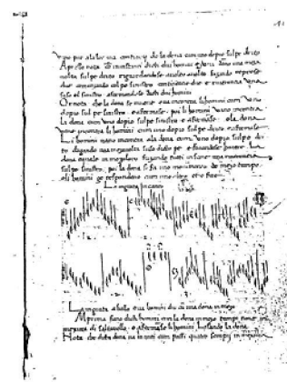
Рис. 1. Доменіко да П'яченцо "Про мистецтво танцю та вміння вести танець"

Найвідомішими учнями Д. П'яченцо, які продовжили пошуки у вирішенні проблеми нотації танців, стали Гульєльмо Ебрео да Пезаро і Антоніо Корназано.