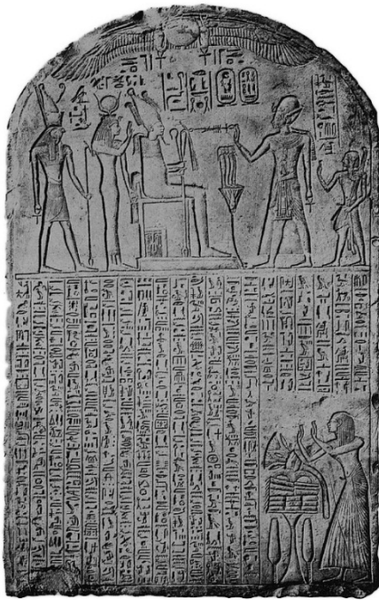
Рис. 2. Stele Brüssel MRAH E. 5300 (9) [26, pl. IV]