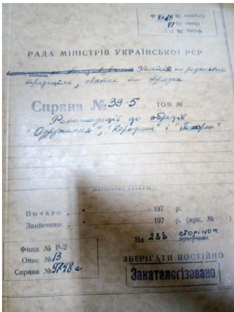
Рис. 2. Справа № 39-5 [8]

Збережене в Центральному державному архіві вищих органів влади та управління України листування Комісії по радянських традиціях, святах та обрядах Ради Міністрів Української РСР з організаціями та окремими громадянами з питань обрядовості (Справа № 39-6) (Рис. 3) та листи подібного змісту на ім'я С.О. Стеценка, засвідчують, що вони надходили з усіх кутків колишнього Радянського Союзу.