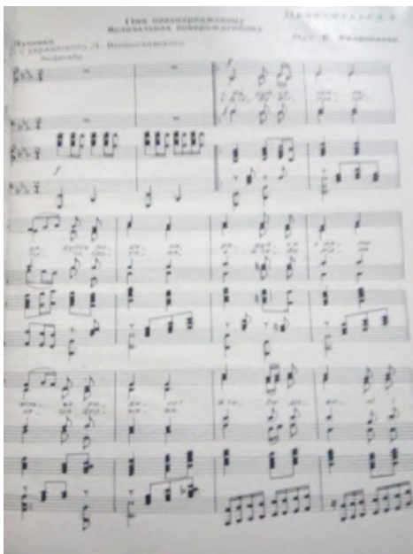
Рис. 4. Перша сторінка нотного тексту "Гімну новонародженому" (музика В. Філіпенка, слова В. Луценка) [8]

вості, яка за законами суспільно-культурної спадкоємності традицій у хронотопі радянської культури по-стала якісно новим явищем, дозволяє констатувати, що формування традицій народної художньої культури було обумовлено зміною суспільно-економічних формацій і соціокультурних систем. Виникнення нових традицій, як правило, відбивало події, що характеризували фундаментальні цільові настанови конкретного суспільно-політичного ладу, при цьому народні традиційні обрядово-ритуальні форми фольклору відігравали роль стримуючого фактора, своєрідного "гальма" для укорінення нових традицій.