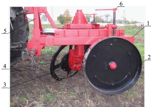
Рис. 1. Внешний вид экспериментальной установки

циентом структурности, который определяли как отношение содержания агрономически ценных агрегатов (0,25–10 мм) к сумме содержания глыбистой (>10 мм) и пылевой (<0,25 мм) фракций. Процентное соотношение фракций определяли путем сухого просеивания на решетчатом классификаторе.