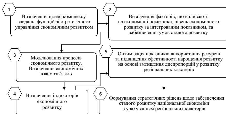
Рис. 3. Логічна послідовність операцій при формуванні стратегічних рішень щодо забезпечення сталого розвитку національної економіки

Концептуальні положення стратегічного забезпечення сталого розвитку припускають розглядати екологічну складову в поєднанні з економічною і соціальною компонентами. З огляду на викладене та результати досліджень сучасних учених [9–11 та ін.], можна виділити певні принципи концептуальних положень стратегічного забезпечення сталого розвитку з позиції інноваційної спря-