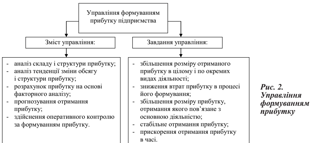
Рис. 2. Управління формуванням прибутку