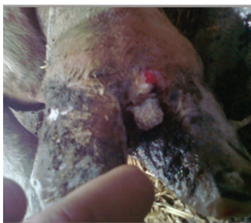
Рис. 1. Ураження копитець за фузобактеріозу