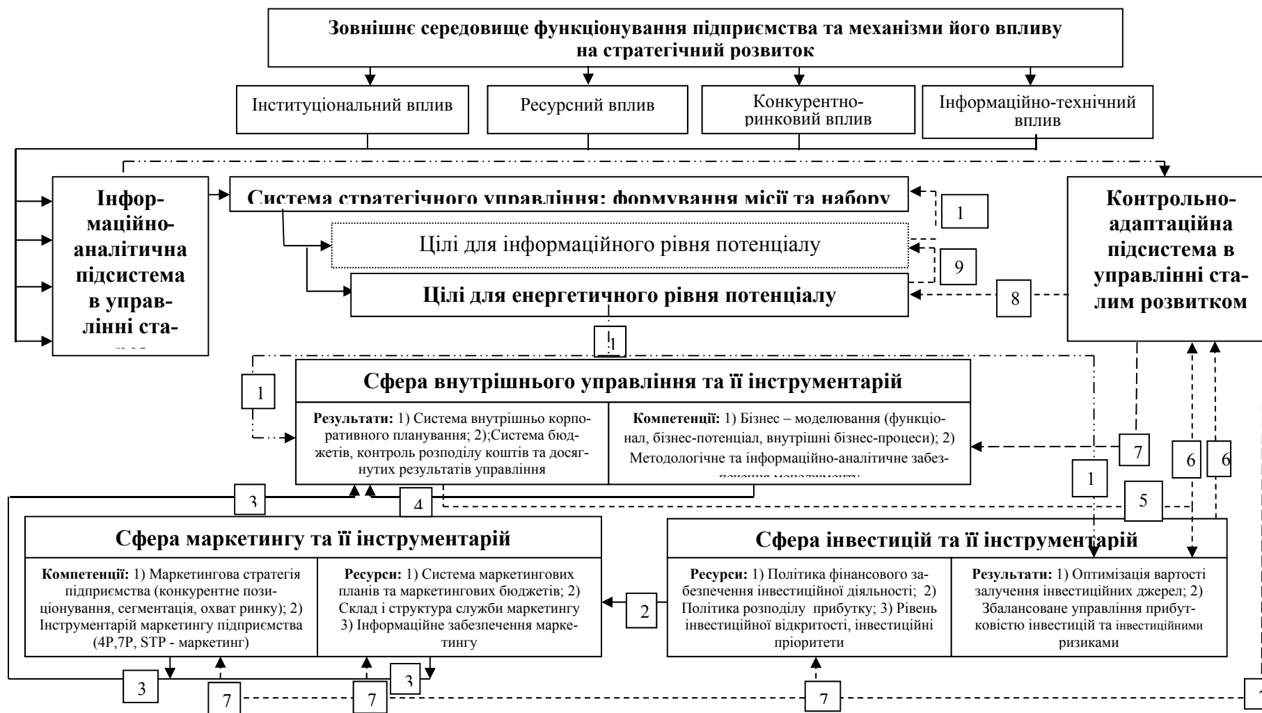
Рис. 3. Бізнес-процес внутрішньорівневої взаємодії функціональних елементів потенціалу розвитку енергетичного рівня (розробка автора)