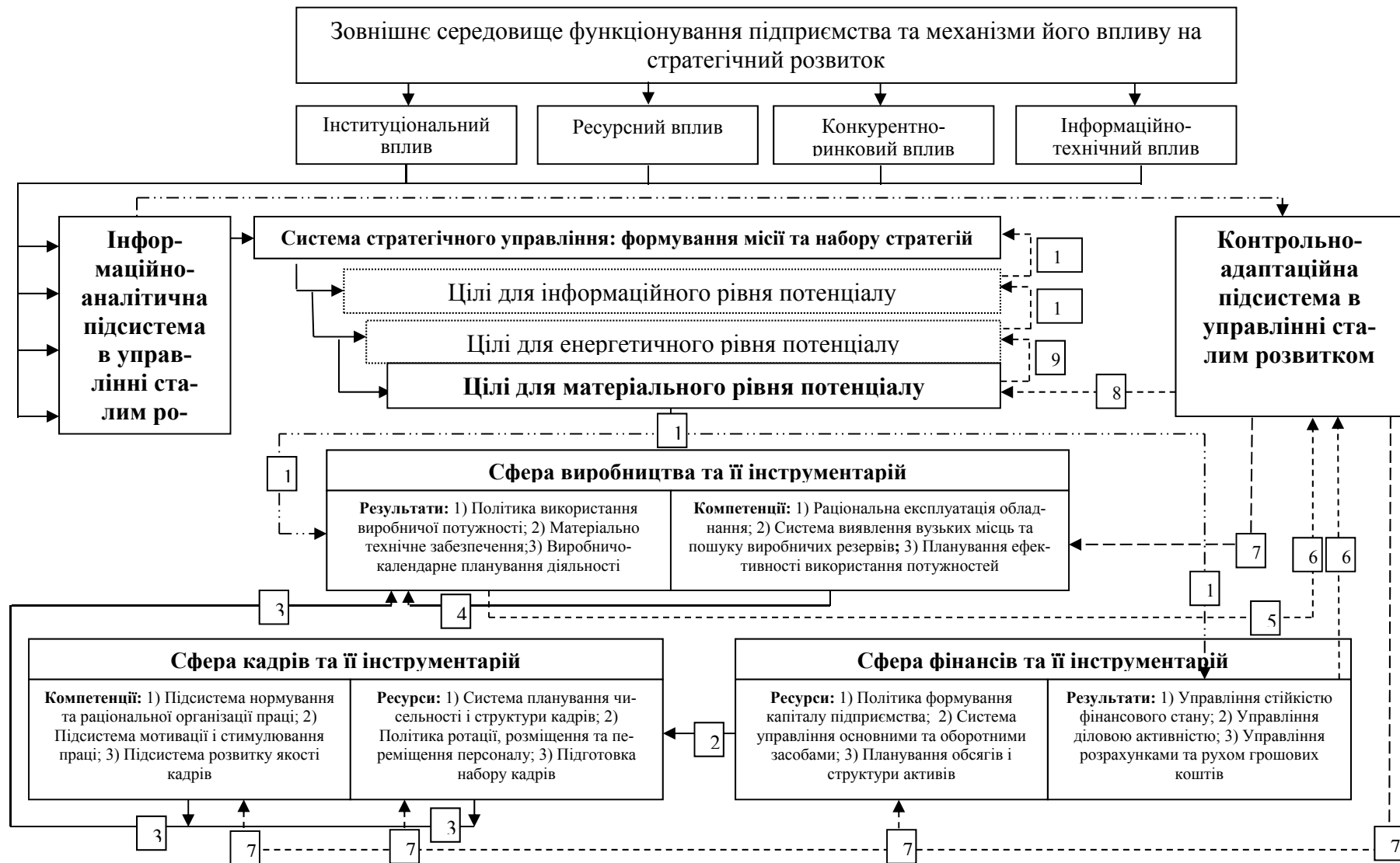
Рис. 1. Бізнес-процес внутрішньорівневої взаємодії функціональних елементів потенціалу розвитку матеріального рівня (розробка автора)