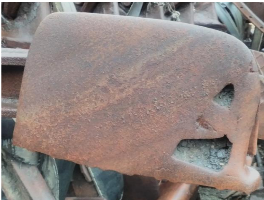
Рис. 3. Вид изношенного башмака