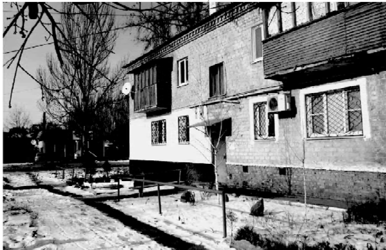
Рисунок 3 – Нынешнее состояние придомовой территории 16-ти квартирного жилого дома по ул. Донецкой в г. Макеевке: частично сохранившиеся направляющие турникеты, завышенные бордюрные камни, широкие скамьи с высокими спинками, островки кустарниковых насаждений с выраженными морфологическими и ароматическими качествами и прочие элементы, предусматривавшиеся в целях облегчения условий ориентации и передвижения слепых (фото авторов, 2014 г.).

зданий имеются определенные отступления от проектных решений, обусловленные их привязкой к конкретной градостроительной ситуации, а также попыткой учесть некоторые специфические потребности слепых: устранение «нормативных» перепадов высот на входах в подъезды, расширение тамбурных пространств и площадок перед входами в квартиры, придание большей устойчивости и надежности перилам и ограждениям на лестничных маршах, смена направлений открывания дверных полотен в помещениях некоторых типов квартир и пр. На придомовой территории 16-ти квартирного дома частично сохранились некоторые элементы благоустройства, которые предусматривались с целью облегчения условий ориентации и передвижения слепых: пешеходные дорожки со специальным мощением и завышенными бордюрными камнями, направляющие турникеты, ведущие непосредственно к подъездам, специальные кустарниковые насаждения и пр. (рис. 3).