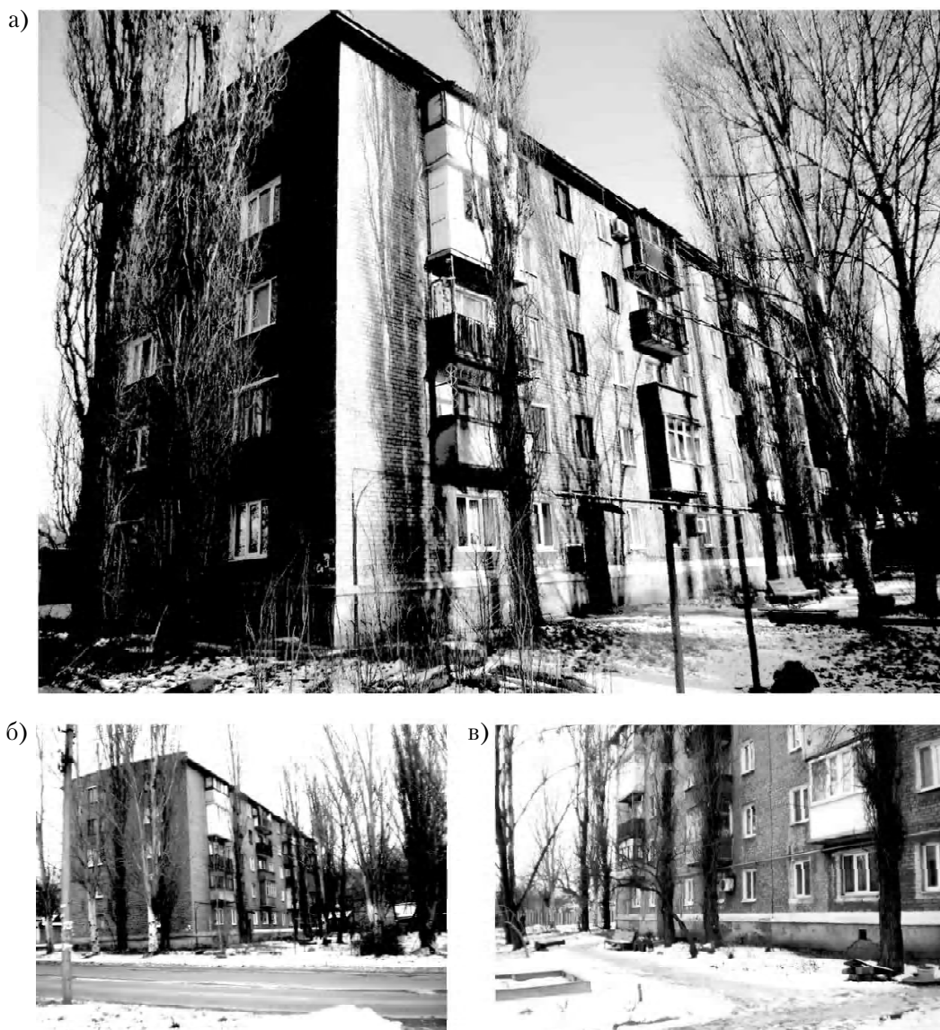
Рисунок 4 – 40-ка квартирный жилой дом по ул. Донецкой в г. Макеевке, построенный в 1967 г. для работников специализированного предприятия УТОС: а – угловой ракурс здания с близкого расстояния при подходе со стороны ул. Донецкой; б – вид на здание с дальнего расстояния со стороны ул. Донецкой; в – фрагмент внешнего облика здания непосредственно со стороны придомовой территории (фото авторов, 2014 г.)

города или заселением в какие-либо изолированные дома-интернаты или общежития. Слепые получили новое жилье практически в самом центре города, что обеспечило им достаточно широкие возможности для активного участия в его общественной жизни, позволило иметь довольно широкий спектр социальных контактов с другими людьми (учитывая, что Центрально-городской район – это один из наиболее населенных и оживленных районов г. Макеевки). Следует сказать, что расширению социальных контактов слепых не в последнюю очередь способствуют определенные условия передвижения, созданные для этих людей в данной части города. Ближайшие транспортные и пешеходные коммуникации в районе жилья и основного места приложения труда инвалидов (предприятие УТОС) обустроены соответствующими дорожными знаками и регулируемыми звуковыми светофорами, которые обеспечивают этим людям определенную степень удобства и безопасности передвижения по городу (рис. 6). Возможность беспрепятственного контактирования со многими разными людьми – есть, как известно, одна из жизненно важных социальных потребностей человека, такой она остается и для инвалидов по зрению. Известно также, если эта потребность не учитывается или каким-либо образом игнорируется, то процесс социальной интеграции таких людей в основную часть общества становится крайне затруднительным или вовсе невозможным [4, 5 и др.].