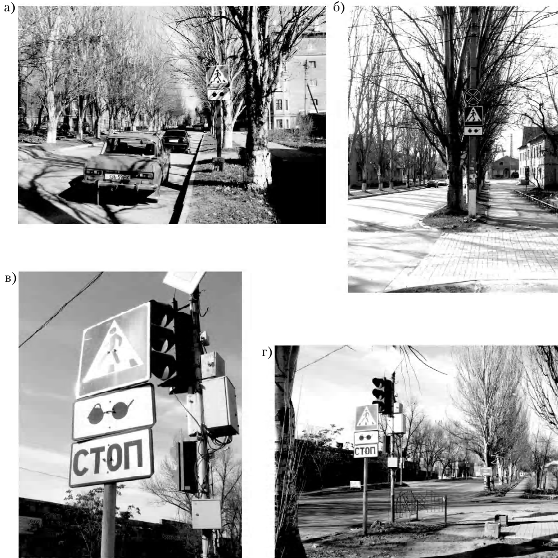
Рисунок 6 – Некоторые элементы благоустройства территории Центрально-городского района г. Макеевки, предусмотренные в целях обеспечения удобства и безопасности передвижения слепых: а – дорожный знак «слепые пешеходы», установленный по ул. Энгельса в непосредственной близости от 16-ти квартирного жилого дома слепых; б – дорожный знак «слепые пешеходы», установленный в районе пересечения ул. Энгельса с местным проездом со стороны столовой УТОС; в, г – дорожные знак «слепые пешеходы» и регулируемый звуковой светофор, установленные в районе пересечения улиц Донецкой и Театральной недалеко от промышленного предприятия УТОС.