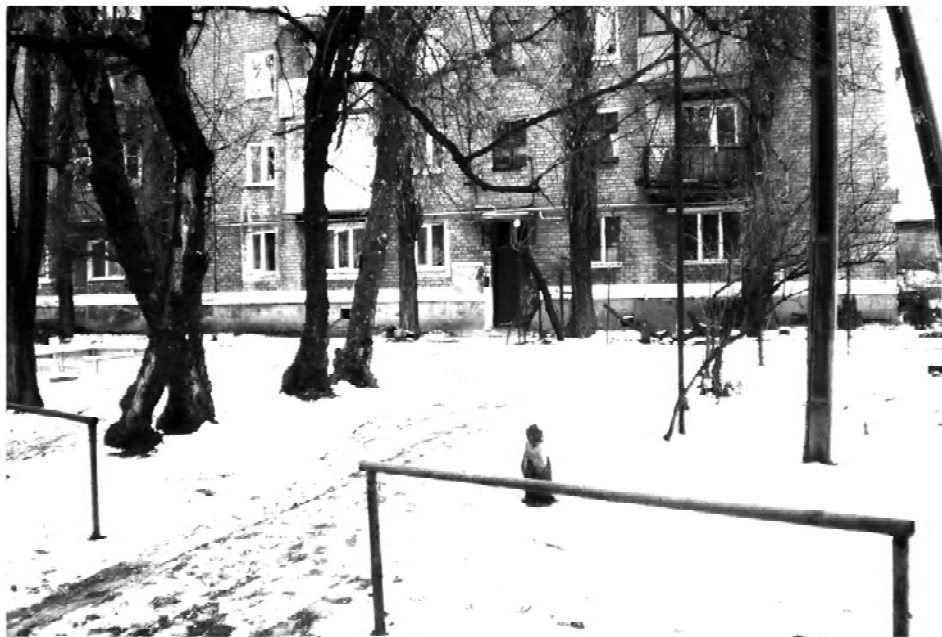
Рисунок 5 – Нынешнее состояние придомовой территории 40-ка квартирного жилого дома по ул. Донецкой в г. Макеевке: частично сохранившиеся направляющие турникеты, тополя и другие породы деревьев с выраженными шумовыми качествами кроны, широкие скамьи с высокими спинками и прочие элементы, предусматривавшиеся в целях удобства ориентации и передвижения слепых (2014 г.).

И, наконец, культурологический критерий, который по сути представляет суммарную итоговую оценку исследуемых объектов с позиций всех рассмотренных выше критериев и связанных с ними аспектов (исторического, градостроительного, архитектурно-планировочного, социального, а также материально-технического, утилитарно-прагматического и, возможно, некоторых других, не охваченных в этой статье). Результат оценивания этих двух жилых зданий, непосредственно построенных для слепых в 60-е гг. прошлого века, с позиций данного критерия может быть сформулирован следующим образом: уровень духовного развития общества на тот период времени был достаточным для того, чтобы проявлять определенное количество внимания и заботы по отношению к тем людям, которые больше всего в этом нуждаются. Нам, живущим в совершенно ином времени и совершенно иных социальных и экономических условиях, этого может показаться недостаточным или, наоборот, чрезмерным. Однако эти немногочисленные материализованные свидетельства позволяют видеть современному обществу, в каком направлении ему необходимо двигаться в своем развитии и что для этого необходимо сделать в первую очередь.