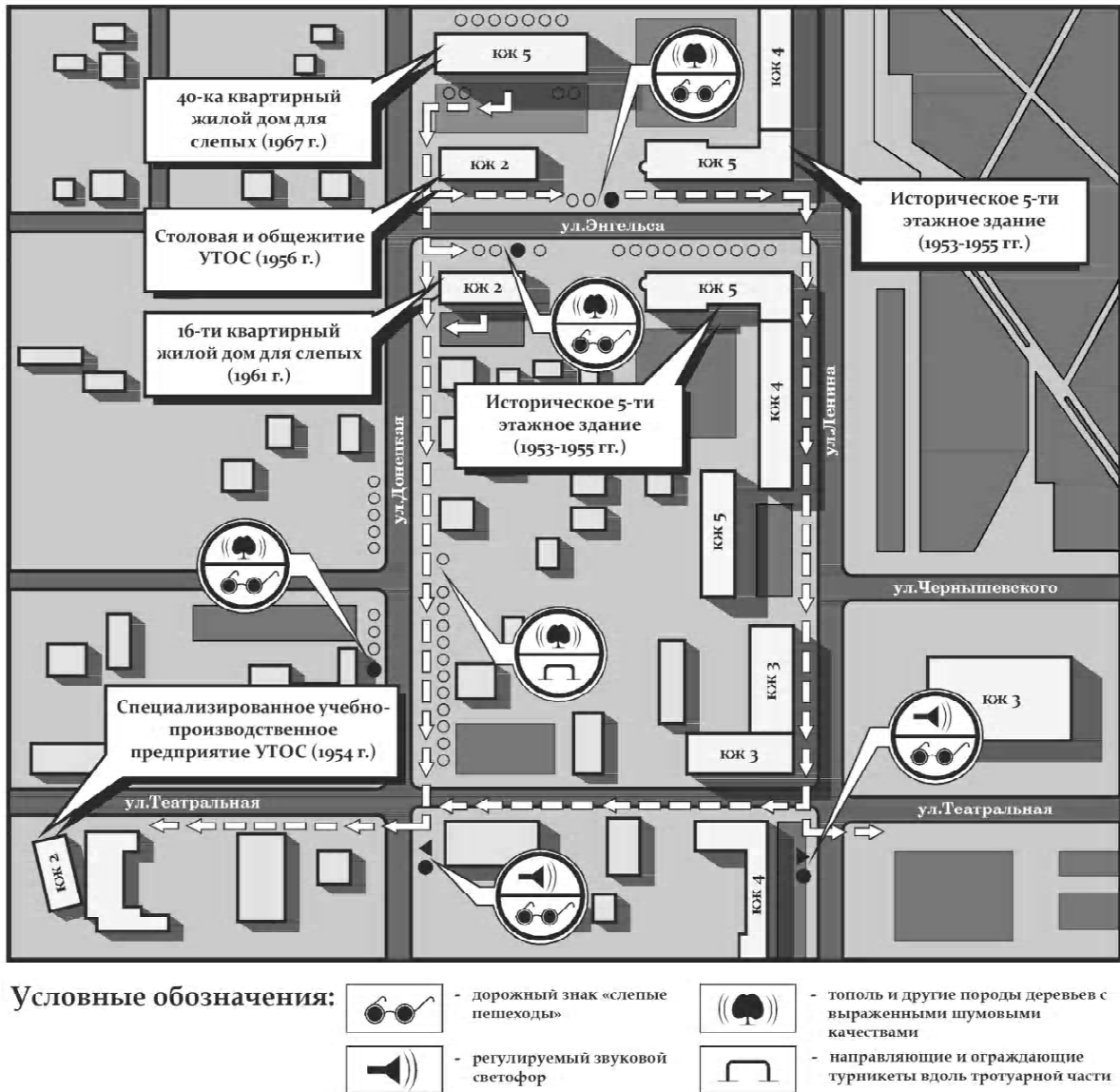
Рисунок 1 – Карта-схема фрагмента территории Центрального-городского района г. Макеевки с указанием мест расположения жилых домов, построенных в начале 60-х гг. XX столетия для работников промышленного предприятия УТОС.

являются совершенно недопустимыми, так как не только не способствуют охране историко-культурного наследия данного города, но и, наоборот, ведут к нивелированию и постепенному выхолащиванию самой сути содержания этого наследия (его значения в деле развития духовной культуры общества). Необычайно высокая социально-культурная значимость таких объектов практически полностью уравнивает их со многими ближайшими и отдаленными зданиями, в том числе и некоторыми историческими, отличающимися от них наличием декора и гораздо большими объемами.