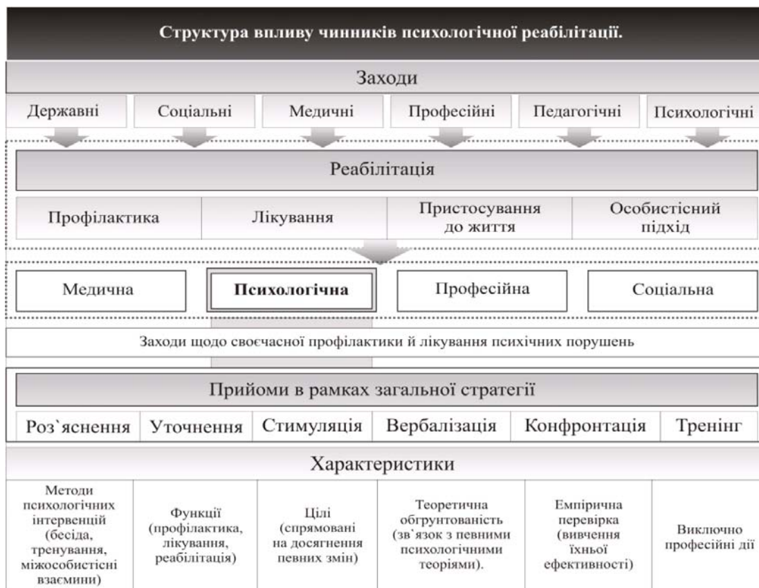
Рисунок 1 – Структура впливу чинників психологічної реабілітації.

«Психологічна реабілітація містить у собі заходи щодо своєчасної профілактики й лікування психічних порушень, по формуванню в пацієнта свідомої й активної участі в реабілітаційному процесі» [7, 2] (рис. 1).