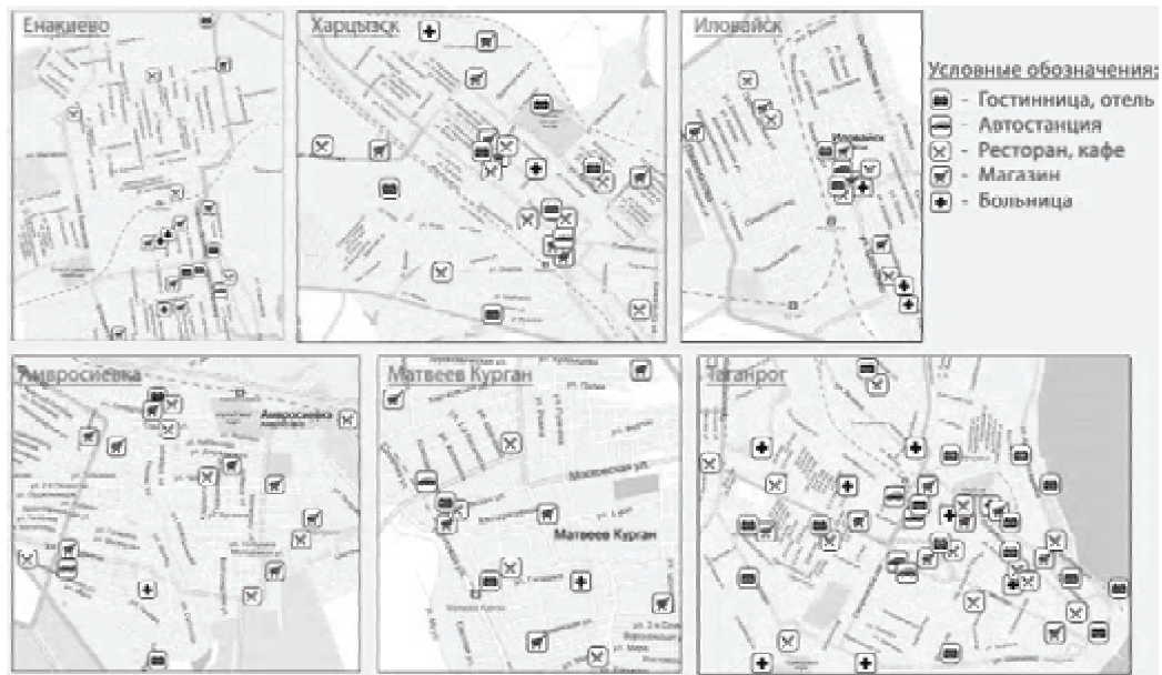
Рисунок 4 – Объекты социального обслуживания в городах маршрута.