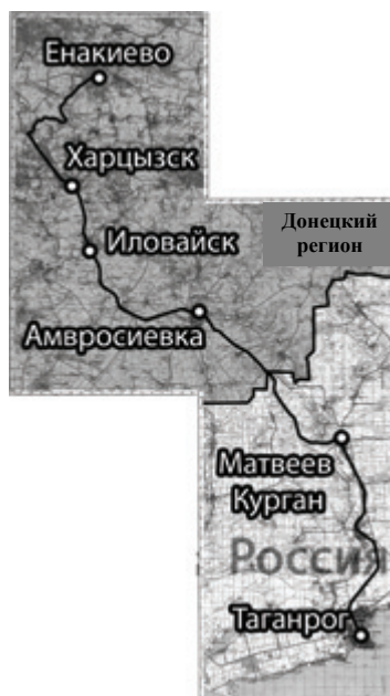
Рисунок 2 – Схема железнодорожного туристического маршрута Таганрог-Енакиево.