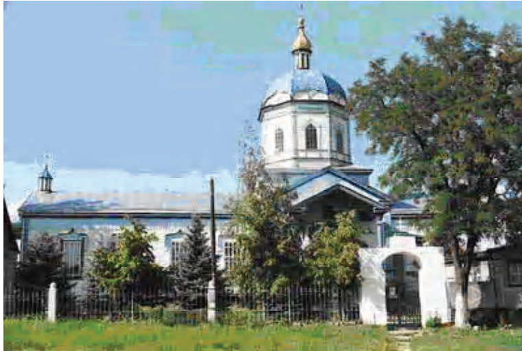
Рисунок 3 – Объемно-пространственное решение: одноглавый однонефный бесстолпный деревянный храм с граненым барабаном. Стилевое решение: русско-византийский стиль с влиянием слобожанских стилиевых решений. Год строительства: 1795–1797 гг.

построены. Они имеют как русскую, так и болгарскую и греческую архитектурно-планировочную композицию и структуру, что придает неповторимости и особенности в облике храма.