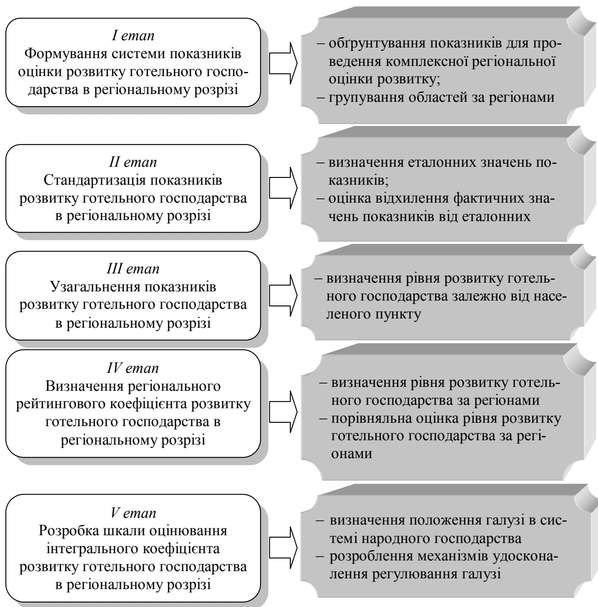
Рисунок 2 – Етапи рейтингової оцінки розвитку готельного господарства України в регіональному розрізі

З урахуванням вищезазначеного, нами виділено етапи рейтингової оцінки готельного господарства, які подано на рисунку 2.