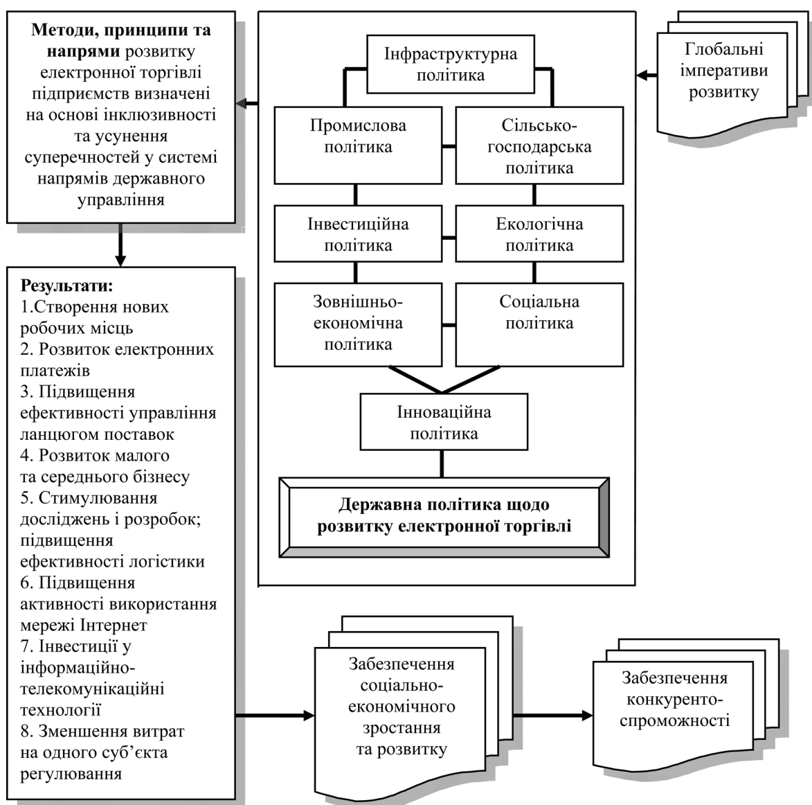
Рисунок 2 — Механізм забезпечення розвитку електронної торгівлі підприємств (розроблено автором)

Використання зазначеного механізму дозволить забезпечити диверсифікацію, комбіноване використання інструментів управління електронною торгівлею підприємств, створити передумови та фактори для забезпечення функціонування й розвитку електронної торгівлі, якісного та кількісного удосконалення параметрів її функціонування, забезпечення соціально-економічного зростання й розвитку, конкурентоспроможності суб'єктів мікро-, мезо- та макrorівнів. Дієвість зазначеного механізму обумовлюється тим, що всі напрями державного управління тією чи іншою мірою створюють умови і спрямовані на перетворення й формування середовища розвитку та забезпечення функціонування електронної торгівлі підприємств. Так, наприклад, державна інноваційна політика, яка визначає особливості розвитку держави в галузі науки і техніки, особливості та перспективи розвитку національної інноваційної системи має критично важливе значення для удосконалення й розвитку електронної торгівлі, адже інноваційна активність суб'єктів господарювання, обсяги державних витрат на інновації, особливості розвитку системи освіти, національної інноваційної системи визначають можливості (ресурсні, інституційні та ін.) країни до реалізації новітніх форм та методів ведення бізнесу. Неможливо розвивати електронну торгівлю,