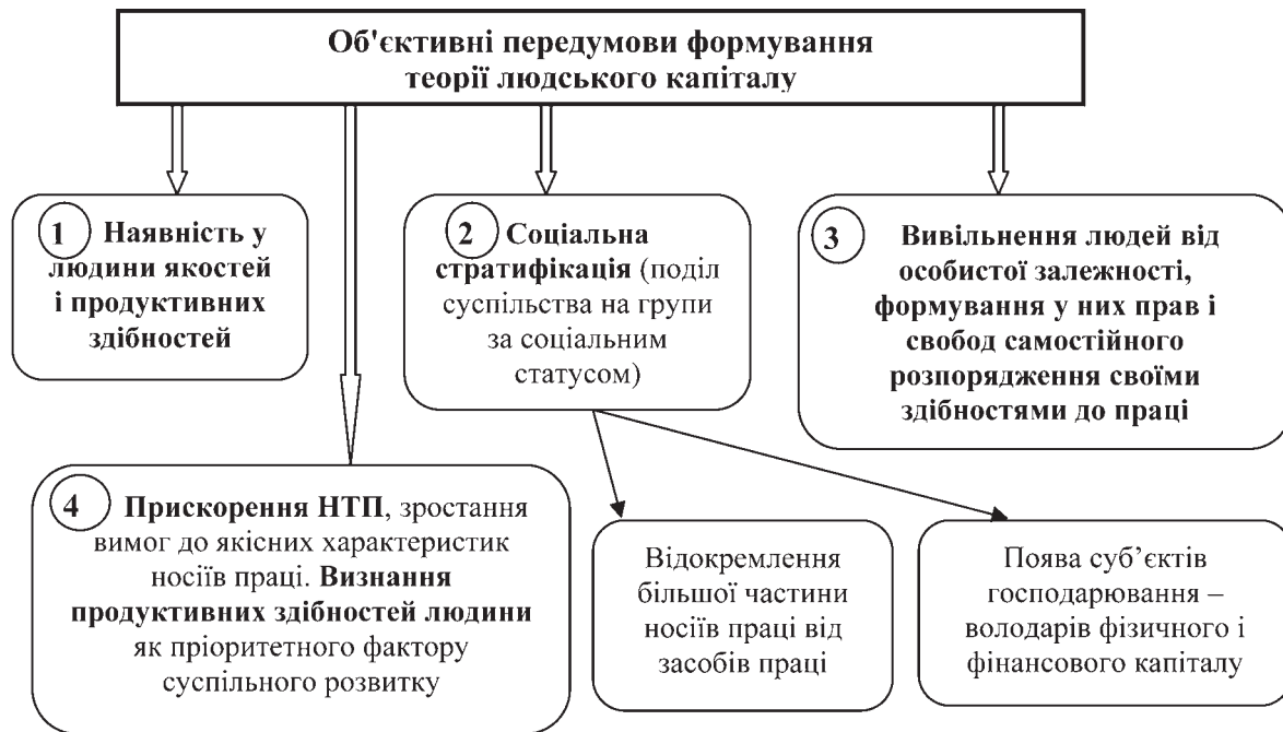
Рисунок 1 — Об'єктивні історичні передумови формування теорії людського капіталу (складено автором на основі власних досліджень)

порції між фізичною і розумовою працею, а економічна наука допомогла систематизувати і пояснити ці зміни з позицій впливу на економічне зростання і з використанням інструментарію економічного дослідження (передумова 4).