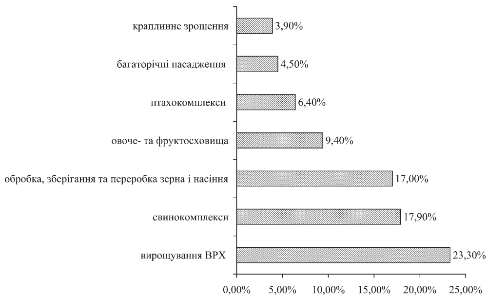
Рисунок 2 — Напрямки реалізації інвестиційних проектів за 2016 рік (сформовано авторами згідно [2,5,6])

Порівняємо кількість проектів у 2016 (рис. 2) і 2017 роках, які реалізувалися і реалізуються за такими напрямками [10]: