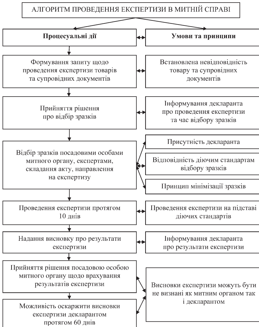
Рисунок 3 — Алгоритм проведення експертизи в митній справі (складено автором за інформацією [5])

На основі аналізу змісту норм джерел митного права сформовано алгоритм проведення митної експертизи, див. рис. 3.