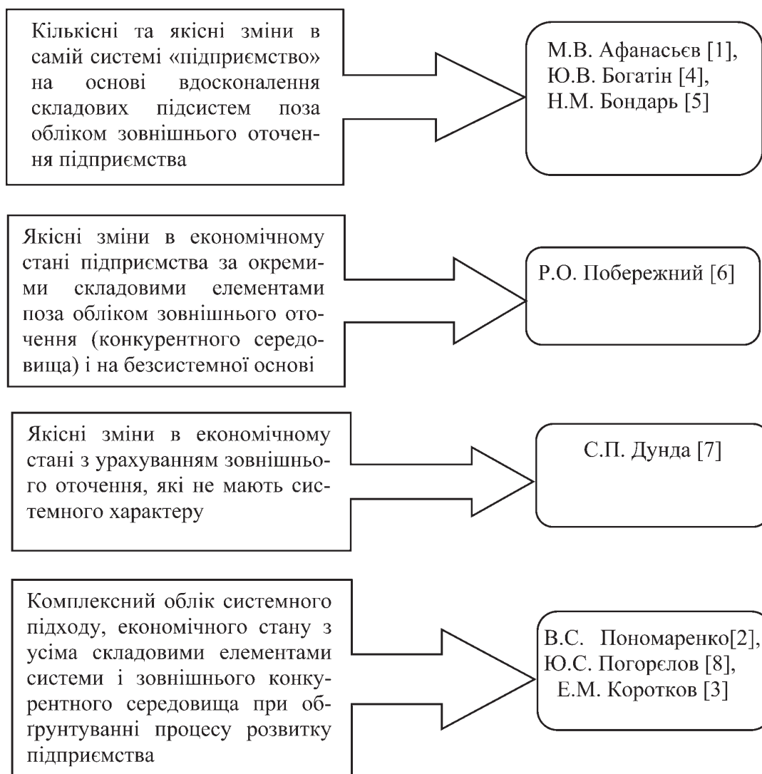
Рисунок 1 — Підходи до визначення поняття «розвиток підприємства» (складено автором на основі [1–8])

Таким чином, узагальнюючи поняття «розвиток підприємства» з виділенням чотирьох наукових підходів, можна відзначити, що існують методологічні неточності щодо його обґрунтування. Тому вважаємо, що необхідно розглядати природу розвитку підприємства як системи і економічної категорії, що є підсистемою галузевої, національної та глобальної економічної системи.