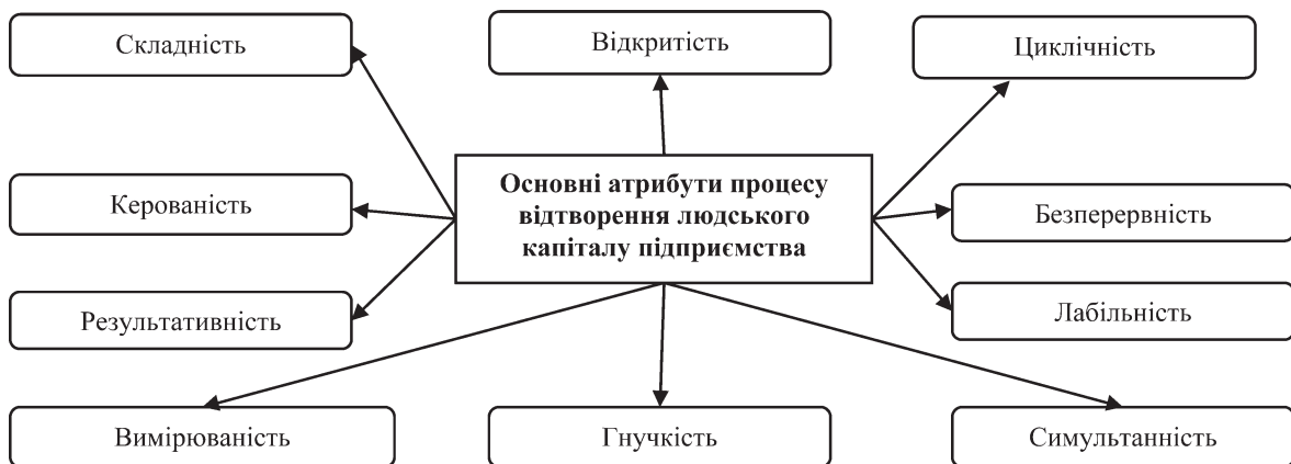
Рисунок 1 — Основні властивості процесу відтворення людського капіталу підприємства (побудовано автором на основі [3; 5; 6; 11; 12])

Ефективний перебіг процесу відтворення людського капіталу підприємства передбачає встановлення набору його основних властивостей, які є тими атрибутами, що за сукупністю однозначно вирізняють його серед інших економічних процесів. Авторське бачення основних властивостей даного процесу, які визначені на основі системного підходу, відтворено на рис. 1.