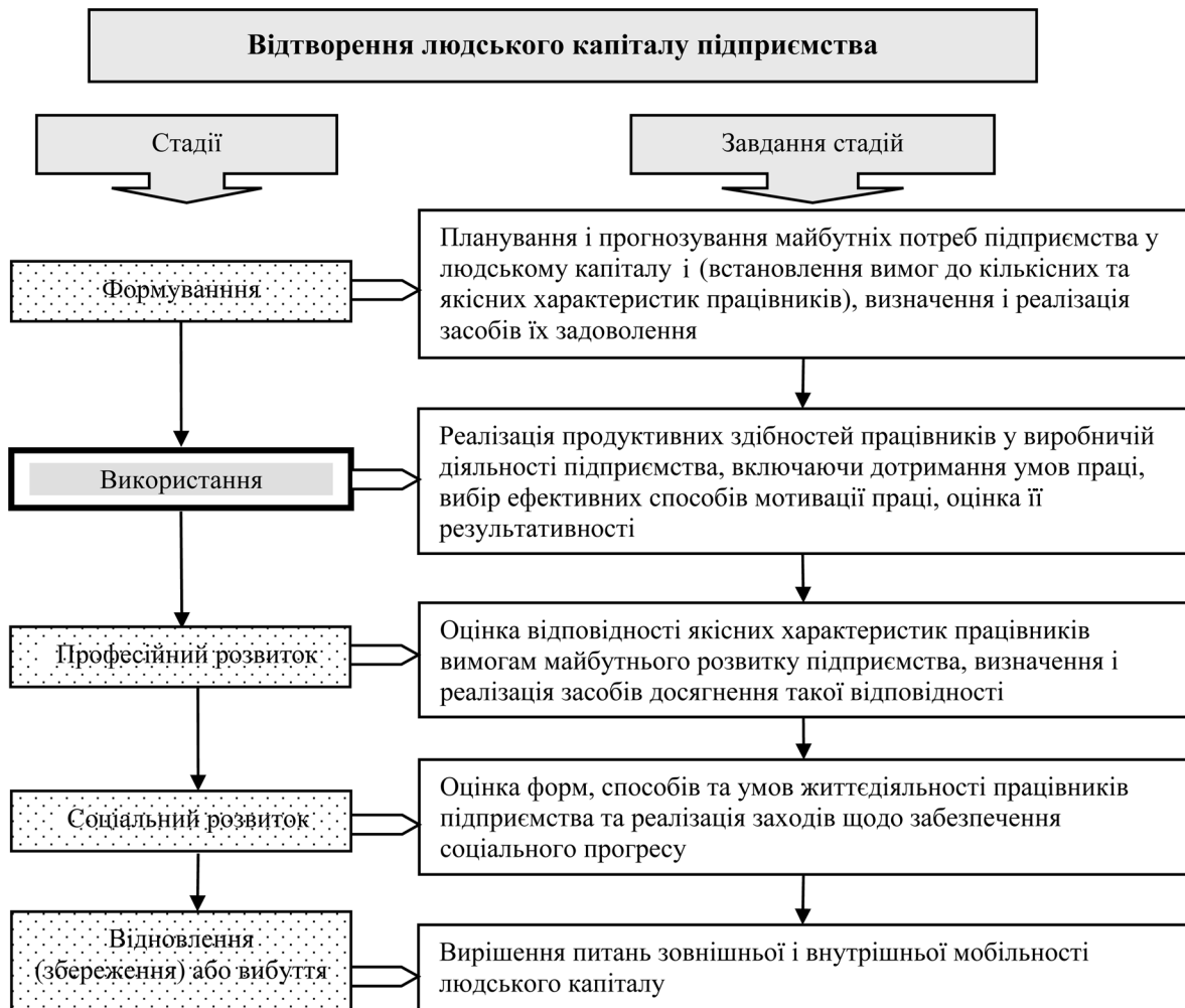
Рисунок 2 — Стадії відтворення людського капіталу підприємства та їх завдання (розроблено автором)