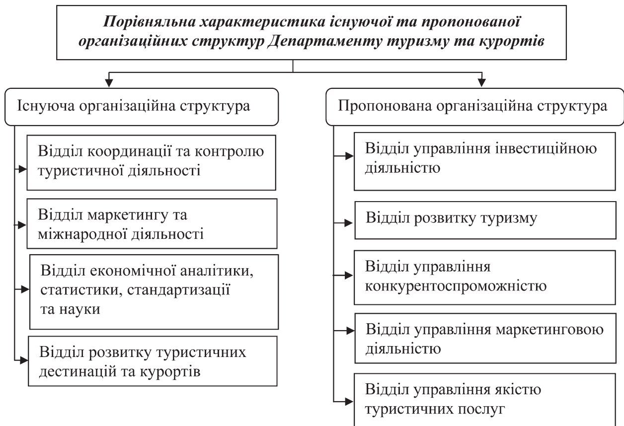
Рис. 2. Порівняльна характеристика існуючої та пропонованої організаційних структур Департаменту туризму та курортів [5]

1. Розроблення і реалізація концепції, що забезпечує функціонування ринку туристичних послуг.