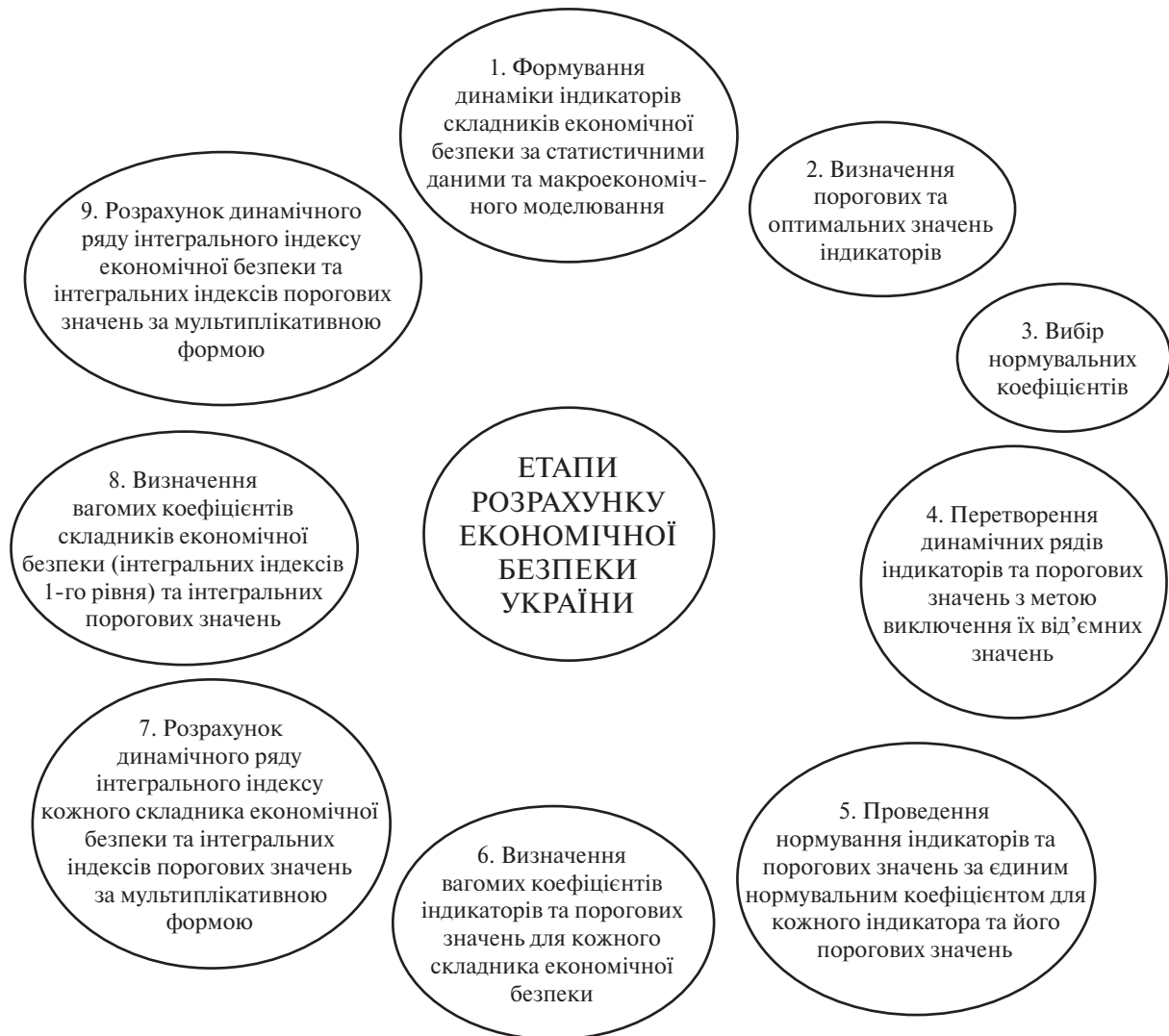
Рис. 1. Етапи розрахунку економічної безпеки України (складено авторами за [1, 5])

— не повною мірою враховується тіньова складова економіки;