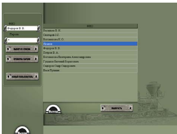
Рис. 2. Форма авторизации пользователя

База данных ведется персонализировано по каждому сотруднику, которому присваиваются пароли для вхождения в тестирующую часть программного комплекса. Это делает возможным контролировать прохождение экзаменов всех сотрудников и делать произвольные выборки для ведения статистики и контроля знаний сотрудниками инструкций по безопасности движения (рис.2).