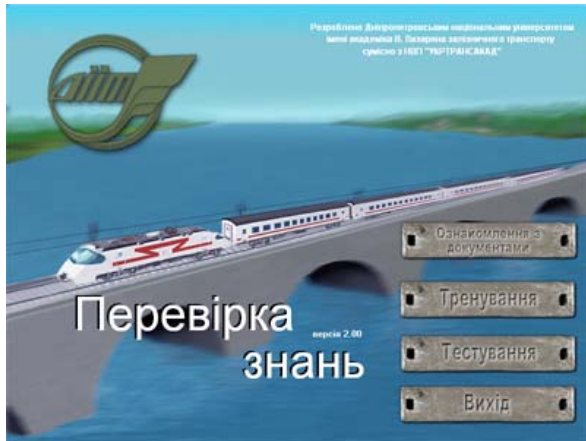
Рис. 1. Главная форма тестирующего модуля

В качестве хранилища данных используется СУБД MS Access, благодаря чему предельно упрощена установка программы, настройка и ее сопровождение. При этом учтен фактор платности программного обеспечения. Ведь на сегодняшний день большинство предприятий Украины использует в качестве операционной системы программное обеспечение Microsoft Windows в пакет которого входит СУБД MS Access. Таким образом предприятию, использующему обучающе-тестирующие программные комплексы, разработанные нашим университетом, нет необходимости покупать дополнительное программное обеспечение по СУБД.