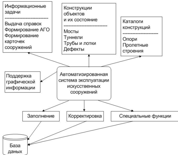
Рис. 2. Схема управления данными в АСУ

и др., которые позволяют хранить повторяющуюся информацию и заносить в таблицы базы лишь код атрибута относящегося к той или иной характеристике. Все поля таблиц базы соответствуют типу предполагаемых данных, легки в работе и привычны для сотрудника соответствующего подразделения, заносящего информацию в базу.