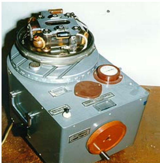
Рис. 2. Промышленный кольцевой лазерный гироскоп

К достоинствам лазерных гироскопов следует отнести прежде всего отсутствие вращающегося ротора и подшипников, создающих силу трения, а также высокую точность измерения.