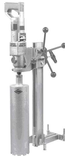
Рис. 7. Керноотборник Cedima H-201 ECO

Для закладки анкеров необходимо бурение в бетоне отверстий различного диаметра для чего можно применять бурильные установки (керноотборники рис. 7)