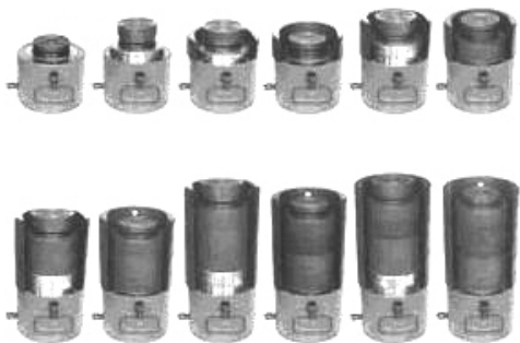
Рис. 6. Домкраты Энерпред ДС

Для ремонта опорных частей необходимо поднимать пролетные строения с использованием специальных домкратов (рис. 6), размер которых зависит от веса пролетного строения. Ремонт опорных частей чаще всего состоит в их полной замене.