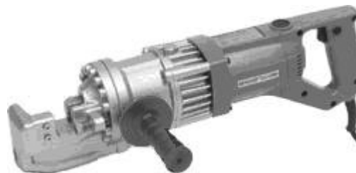
Рис. 3. Ручной резчик арматуры Bendof DC-20MX

При ремонте элементов пролетного строения иногда возникает необходимость добавления или частичной замены арматуры, подвергшейся коррозионному разрушению. Доставка готовых арматурных изделий осуществляется с заводов железобетонных конструкций или изготавливаются на месте. Для чего необходимо иметь оборудование для порезки и изгиба арматуры (рис. 3).