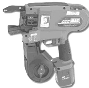
Рис. 4. Пистолет для вязки арматуры MAX RB650 A

Дальнейшие работы с арматурой связаны с ее установкой. Это действие, возможно, выполнить двумя способами: сварка и вязка. Для сварки применяют в основном электрические сварочные аппараты. Вязка арматуры возможна вручную или при помощи специальных ручных инструментов (рис. 4).