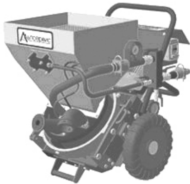
Рис. 5. Торкрет установка АС-1 фирмы Альпсервис

сения бетонной смеси путем набрызга или бетонирования с использованием опалубки. Торкретирование позволяет не использовать достаточно дорогостоящих опалубок и является довольно известным методом, но для его использования необходимы специальные установки, выпускаемые зарубежными и отечественными производителями (рис. 5). Высокопроизводительная технология нанесения бетонной смеси торкрет установками целесообразна при восстановлении защитного слоя на больших по площади поверхностях.