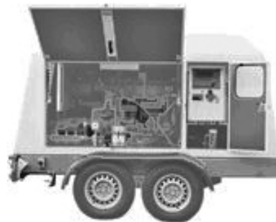
Рис. 2. Аппарат гидродинамической очистки бетона Woma Ecomaster 250M-MK3

Удаление поврежденного слоя бетона пролетного строения выполняют с применением различных механизмов (легких отбойных молотков или перфораторов, пескоструйного или гидродинамического оборудования). При использовании отбойных молотков или перфораторов необходимо избегать повреждения стальной арматуры и особую осторожность проявлять при работе с предварительно-напряженными элементами. Применение высокопроизводительной пескоструйной и гидродинамической очистки возможно при больших площадях поврежденных участков бетона. Аппараты гидродинамической очистки (рис. 2) при определенном давлении потока воды позволяют снять поврежденный бетон, а также удалить продукты коррозии с оголенных участков арматуры.