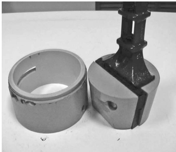
Конусное фиксирование анкера (отменено)

вующий конусный вид фиксирования анкера в форме – фотография слева, нужно заменить (см. рис. 4). На сегодняшний день на заводе ЖБШ ТОО «Магнетик» полностью переконструирован парк форм на прямоугольное фиксирование анкера в форме при помощи фиксаторов из упругих пластмасс (на рис. 4 справа).