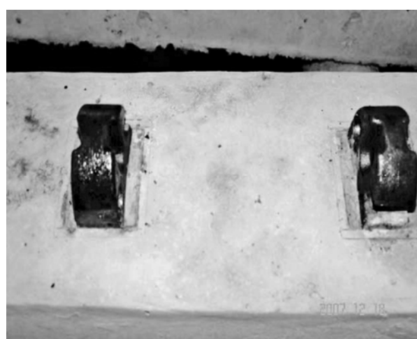
Поверхность железобетонной шпалы с прямоугольным фиксированием анкера в форме