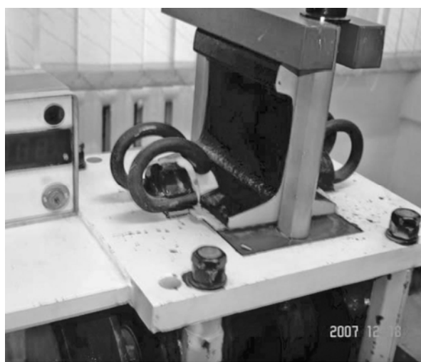
Рис. 2. Испытательные приспособления лаборатории ТОО «Магнетик»

Работоспособность и долговечность всего узла крепления пришлось еще раз доказывать представителям железной дороги, так как по ряду причин, из-за несовершенства конструкции, крепление закладного анкера в форме было нестабильно. Глубина заложения анкера в