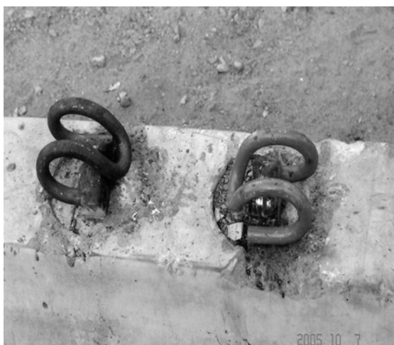
Поверхность железобетонной шпалы с конусным фиксированием анкера в форме

теле железобетонной шпалы превышала предельные допуски \pm 0,5 мм из-за уплыва конусных фиксаторов [1]. На поверхности подрельсовой площадки наблюдались углубления или наплывы бетона выше допустимых норм и доходили до 3-х и более мм (рис. 3).