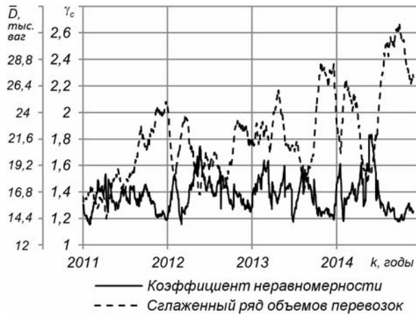
Рис. 4. Анализ суточной неравномерности поступления груженых вагонов на станцию Химическая