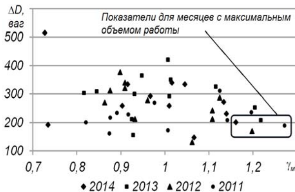
Рис. 3. Связь между коэффициентом месячной неравномерности и величиной максимального превышения среднемесячных объемов прибытия вагонов в данный месяц

В этой связи выполнен анализ условий работы магистральных и промышленных станций в отдельные сутки. В качестве примера в данной статье рассмотрено поступление вагонов на станцию Химическая в течение 2011–2014 годов. На рис. 3 представлено поле точек, характеризующее связь между коэффициентом месячной неравномерности – \gamma_M и величиной максимального превышения среднемесячных объемов прибытия вагонов в данный месяц – \Delta D .