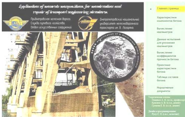
Fig. 2 Interface of developed software

The computer program is adapted to implement the intellectual decision support system that allows in interactive and convenient form to solve the problem of hydraulic concrete composition design with desired properties, taking into account the characteristics of the concrete mix components.