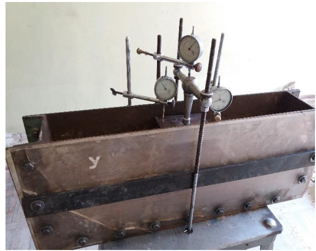
Fig. 1. Model of soil bank in trough with measuring devices.

loaded the tested model fixing the readings of the measuring devices.