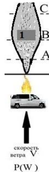
Рис. 1. Вероятность появления зон поражения для различных метеоситуаций: 1 – здание

химически опасного вещества. При прогнозе нас интересуют те точки области в районе теракта, где концентрация химически опасного вещества превышает некоторое пороговое значение, при котором происходит та или иная степень поражения людей. Схематически на рис. 1 показана ситуация попадания рецепторов А, В, С под действие источника эмиссии (баллона, в котором находится токсичный газ), причем отметим, что выброс происходит в условиях застройки.