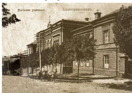
Building, which hosted the Dnepropetrovsk University (20-30th years of the XXth century)