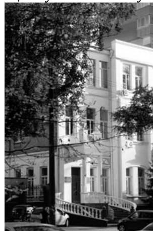
The building of the Institute of Physical Chemistry (Dnepropetrovsk, 30's of the XXth century)

Повернувшись в Україну, вчений взяв участь у V Всесоюзній конференції з фізичної хімії, яка проходила у травні 1929 р. в Дніпропетровську. Поряд з Москвою та Ленінградом Дніпропетровськ був тоді одним із провідних центрів розвитку фізичної хімії, яка переживала період зростання. Тут діяв заснований академіком Л. В. Писаржевським Український науково-дослідний інститут фізичної хімії (зараз – Інститут фізичної хімії АН України ім. Л. В. Писаржевського). Створювалась і стрімко зростала наукова фізико-хімічна школа. Наукова атмосфера в місті, організація наукових досліджень в Інституті приємно вразили Володимира Соломоновича; він побачив тут перспективи подальшого професійного зростання і вирішив переїхати до Дніпропетровська. Новий навчальний рік він розпочав викладачем Гірничого інституту, найстарішого навчального закладу міста. Паралельно став працювати в Інституті фізичної хімії. Уже наступного року (за даними [1; 12] того ж таки 1929 р.) він стає заступником директора Інституту фізичної хімії та завідувачем відділу теоретичної та прикладної електрохімії [3]. Після відкриття в 1930 р. в Дніпропетровську Хіміко-технологічного інституту починає працювати і в цьому навчальному закладі.