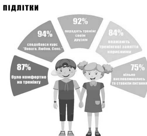
Рис. 3. Результати дослідження анкет зворотного зв'язку підлітків

Аналіз результатів дослідження зворотного зв'язку підлітків довів таке: 75% підлітків вільно висловлювали свої думки та ставили запитання тренерам під час тренінгового курсу; 84% підлітків вважають тренінгові заняття корисними; 87% підлітків було комфортно на тренінгових заняттях; 92% підлітків порадять тренінговий курс своїм друзям та одноліткам; 94% підлітків сподобався курс «Повага. Любов. Секс».