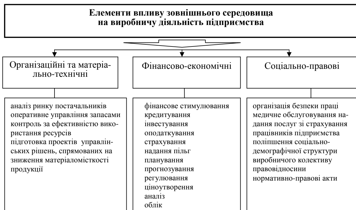
Рисунок 2 – Елементи зовнішнього середовища, які впливають на виробничу діяльність підприємства

Ступінь впливу вищеперерахованих елементів зовнішнього середовища залежить від багатьох факторів, у тому числі від виду економічної діяльності та форми власності підприємства. Так, наприклад д, у 2010 р. порівняно з аналогічним періодом 2009 р. обсяг реалізованої продукції в сільськогосподарському секторі зменшився на 5 %, що становило 3460 млн грн [16, с. 148], а у промисловому секторі він навпаки виріс на 24,4 %, що дорівнює 260581,7 млн грн [16, с. 106].