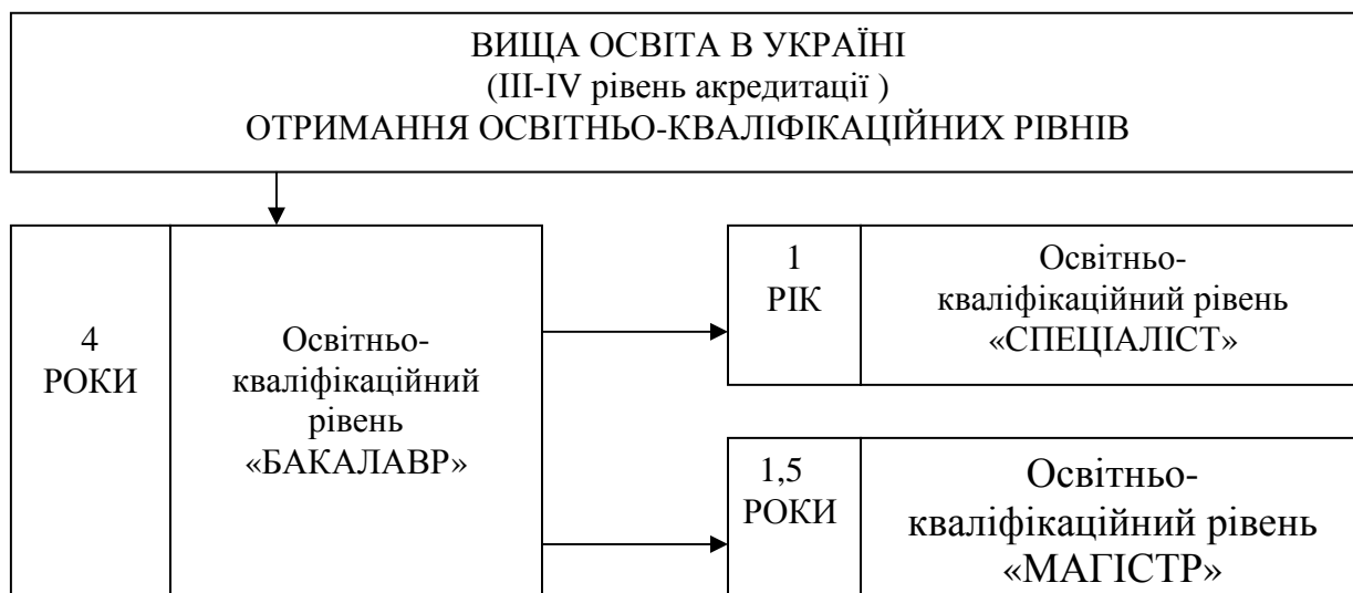
Рисунок 1 – Рівні вищої освіти в Україні

Кожний вищий навчальний заклад має дворівневу систему навчання для отримання освітньо-кваліфікаційних рівнів, структуру (терміни) більшість яких автор наводить у схемі на рис. 1.