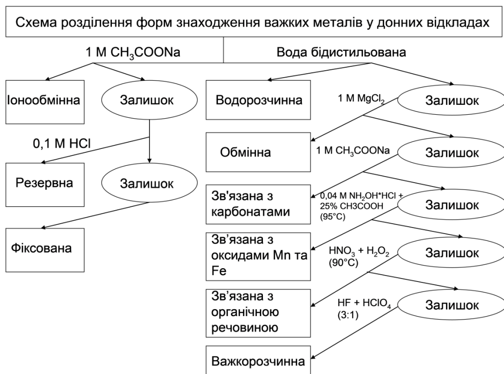
Рис. 1. Схема розділення форм знаходження важких металів