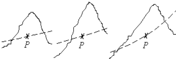
Рис. 2. Окремі ділові цикли з відзначенням тенденції ділової активності

Проте при такому аналізі втрачається бачення руху тенденції в межах окремого циклу. Детальніший аналіз чисельного ряду може дати нам уяву про тенденцію ділової активності, як, наприклад, на рис. 2.