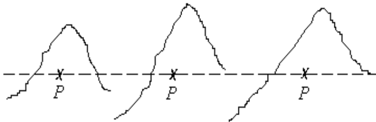
Рис. 1. Окремі ділові цикли як відхилення від середнього значення

Виявлення циклу з чисельного ряду неперевічених даних є складною проблемою. Необхідно виявити в тенденціях зростання чи падіння певні значення, що свідчили б про наявність ділового циклу. Насамперед, велике значення має виявлення поворотних пунктів у діловому циклі. Нижні поворотні пункти дозволяють виділити з коливань ділової активності конкретні повні цикли. Співставлення таких циклів дає можливість їх порівнювати, як показано на рис. 1. Середнє значення ( \rho ) упродовж індивідуального циклу приймається за 100 %, а всі інші вважаються відхиленнями від нормального значення, позначеного пунктирною лінією.