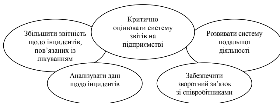
Рис. 3. Формування культури безпеки [17]

Саме тому необхідно створювати культуру безпеки в рамках організаційної культури медичного закладу. Для цього потрібно ужити таких заходів (рис. 3):