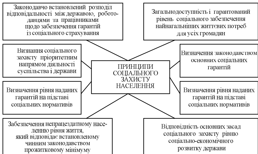
Рис. 2. Принципи соціального захисту населення (узагальнено автором за [21])

Розглядаючи сутність понять, необхідно зазначити, що соціальний захист, на відміну від соціального забезпечення, передбачає гарантії щодо охорони праці, здоров'я, навколишнього природного середовища, оплати праці та інші заходи, необхідні для нормальної життєдіяльності людини й функціонування держави. Соціальне забезпечення, порівняно із соціальним захистом, є вузьким поняттям і означає практику виплати пенсій, адресної соціальної допомоги, соціального догляду.