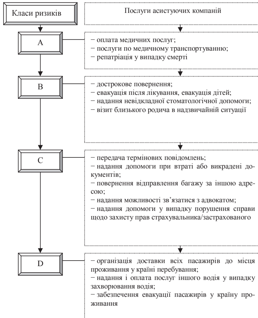
Рис. 1. Акумуляція ризиків за класами за даними асистуючих компаній (джерело: [4, с. 22])

приписані лікарем; медичне транспортування до найближчої лікарні, а також у країну постійного проживання з медичним супроводом; репатріація останків; екстрена стоматологічна допомога [10, с. 296]. Причому така форма страхування передбачає взаємодію страховика з асистуючими компаніями, що визначає високий рівень витрат за договорами страхування та є уособленням специфічних суб'єкт-суб'єктних відносин саме у страхуванні туризму.