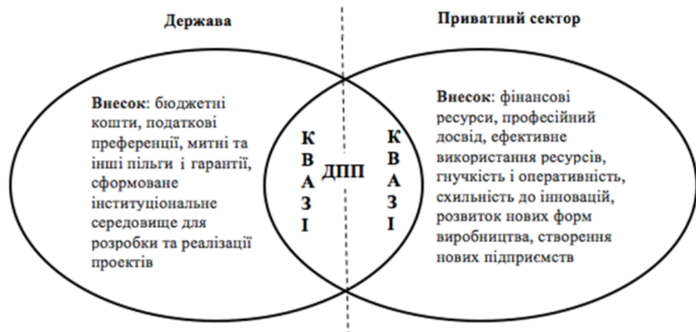
Рис. 2. Раціональне співвідношення між партнерами ДПП (джерело: склав автор)

Спираючись на результати дослідження базисних теорій ДПП, автор статті визначив раціональне співвідношення між державою та приватним сектором, що зображено на рис. 2.