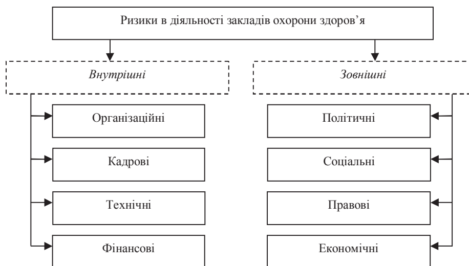
Рис. 2. Класифікація ризиків діяльності закладів охорони здоров'я

За видами можуть бути виділені організаційні, політичні, правові та інші ризики, що належать до однієї із вказаних вище категорій.