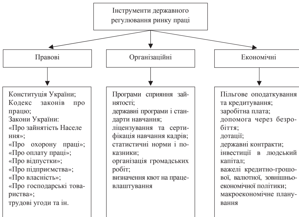
Рис. 2. Інструменти державного регулювання ринку праці

Виділимо наступні інструменти державного регулювання ринку праці: правові, економічні, організаційні (рис. 2).