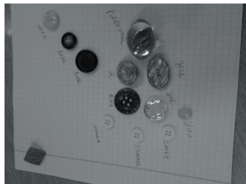
Предметна модель «Події мого життя»