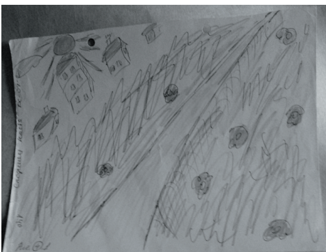
Малюнок «Дорога вибору»

Реконструкція автобіографічного антиципування здійснюється за використання таких прийомів: символізації життєвого шляху з допомогою авторських або неавторських (листівок, репродукцій) психомалюнків «Дорога мого життя», схематизації подій життя «Лінія життя», використання предметної моделі «Життєвий шлях» (рис. 2).