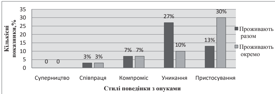
Рис. 3. Розподіл стилів поведінки людей похилого віку в конфліктних ситуаціях з онуками

це люди поважного віку, їхній стан здоров'я не завжди дає можливість бути активними, самостійно задовольняти всі свої потреби, тому вони відчують деяку залежність від молодого покоління, особливо від своїх дітей і тому не бажають погіршувати з ними стосунки, конфлікти прагнуть згладити або пристосуватися до ситуації, яка склалася.